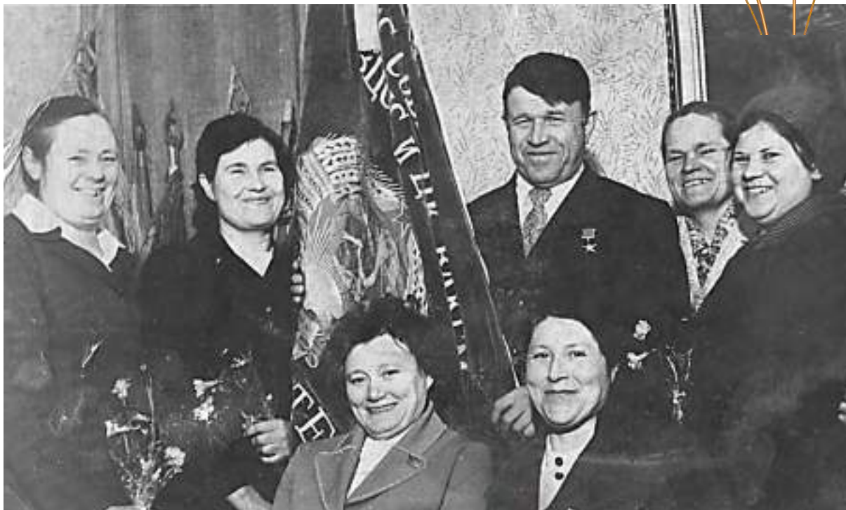
Передовики производства совхоза Ижевский с переходящим Красным Знаменем