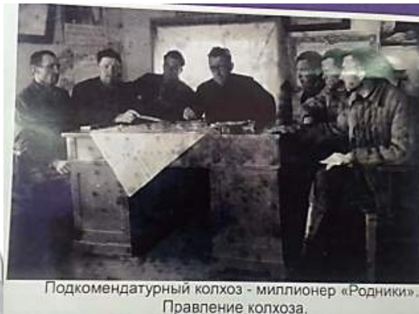
Подкомандатурный колхоз - миллионер «Родники». Правление колхоза.